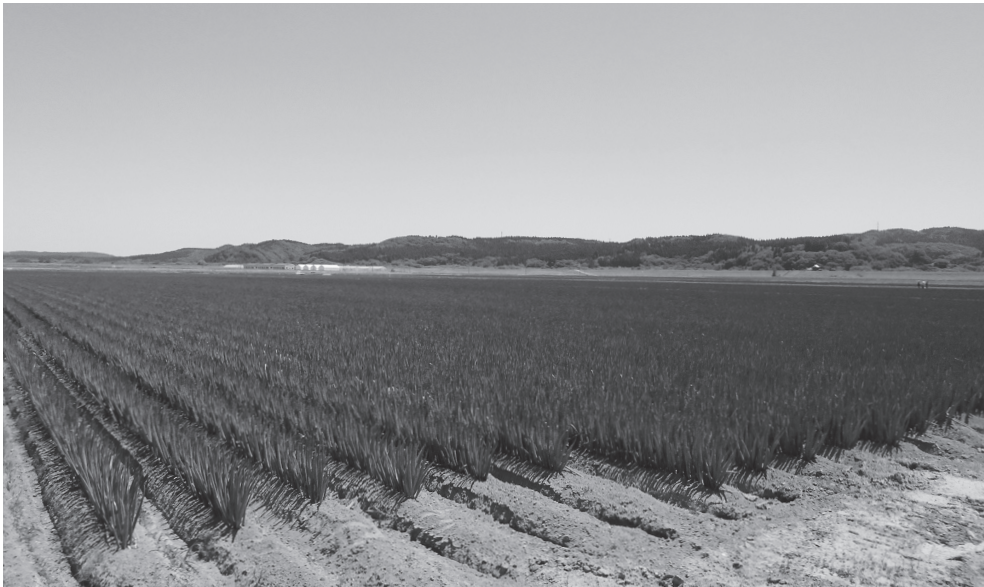
ほ場整備実施後のねぎメガ団地