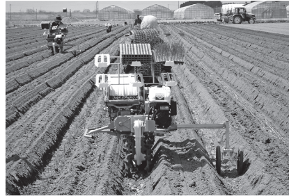
◀ポット型苗の機械定植