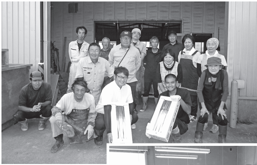
▲轟地区 ゆかいな仲間たち