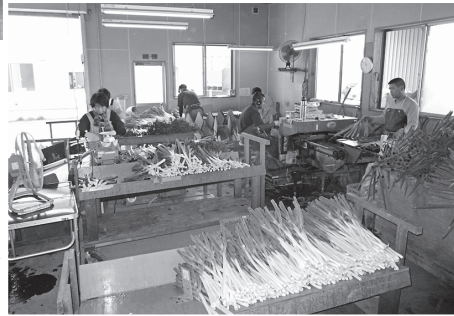
調整作業▶ (根葉切り、皮むき、 結束、箱詰め)