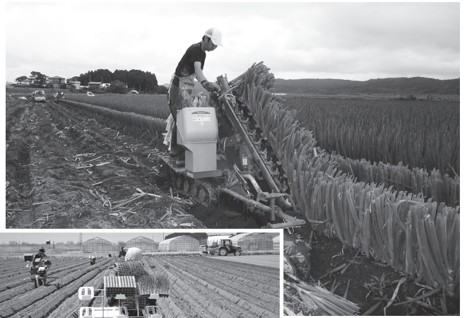
▲ねぎ振り取り・運搬状況