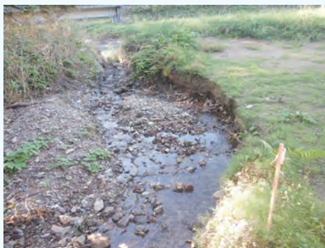
▲農地の被害状況と現場調査状況