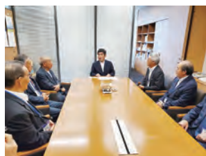
▲福原議員への要請