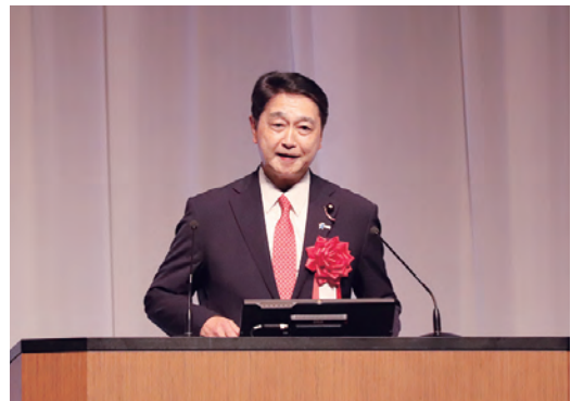
▲進藤金日子参議院議員の挨拶