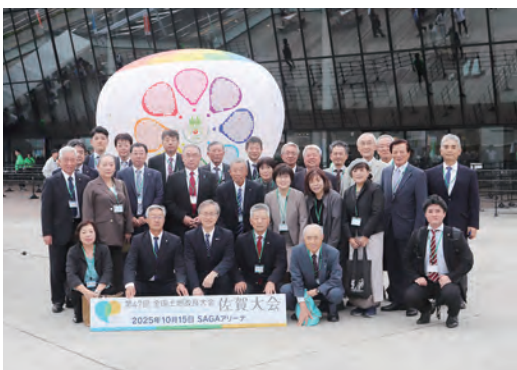
▲秋田県参加者(総勢28人)