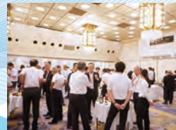
▲情報交換会の様子