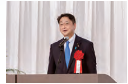
▲進藤金日子参議院議員による来賓祝辞