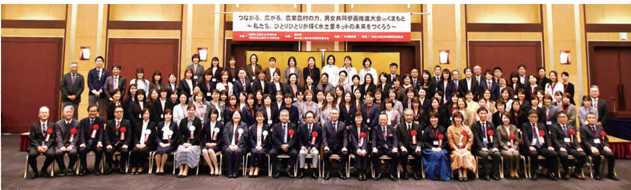
▲集合写真(大会参加者)