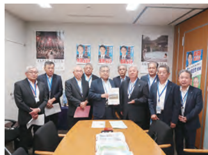
▲進藤議員への要請