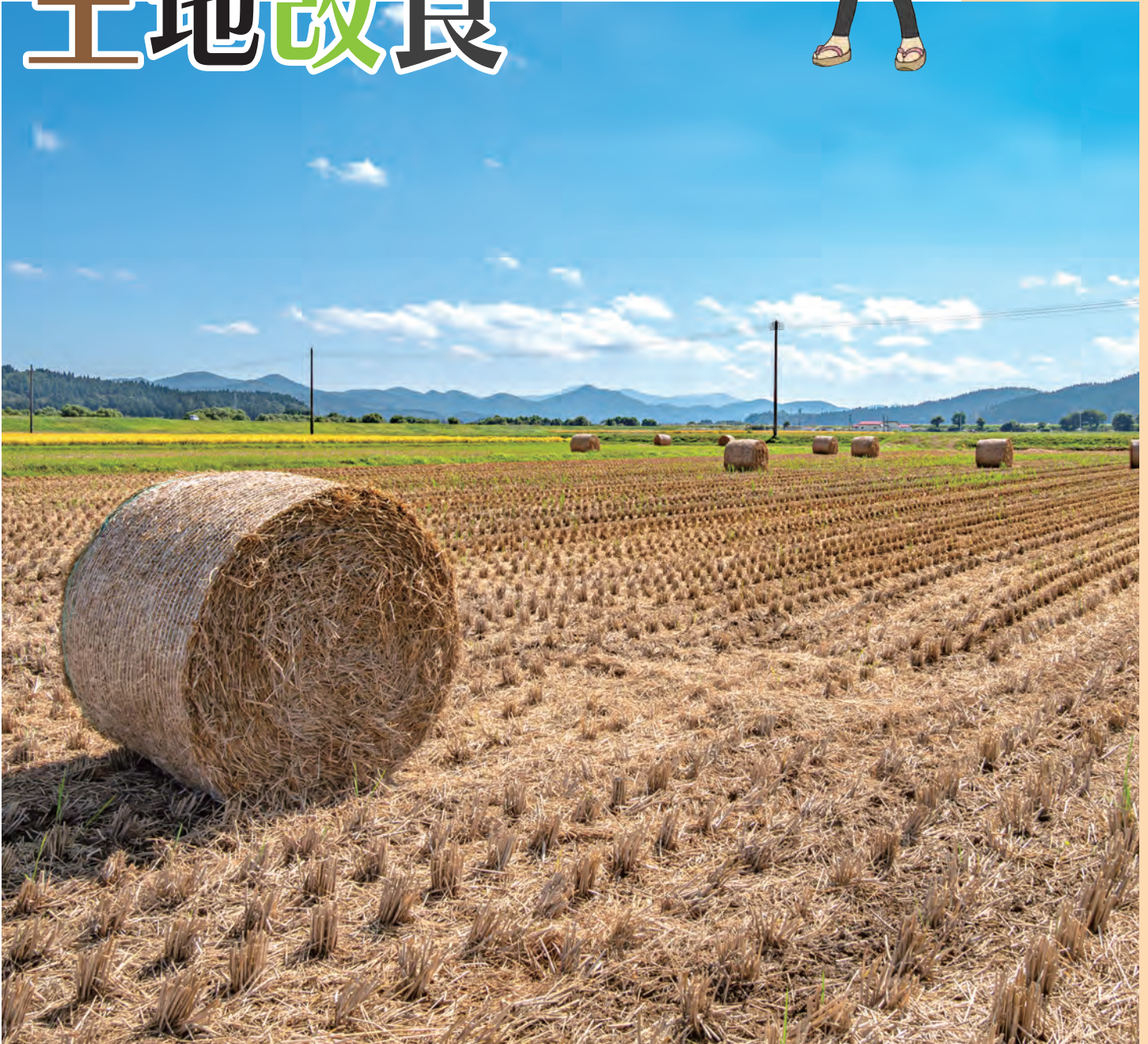
第25回「あきたの美しく豊かな農村づくり」写真コンクール入賞作品 優秀賞(秋田の農業&農村部門)「秋景」秋山 幸子 撮影場所:由利本荘市