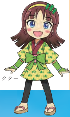
イメージキャラクター みどりちゃん