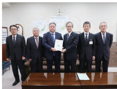
▲松本局長への要請