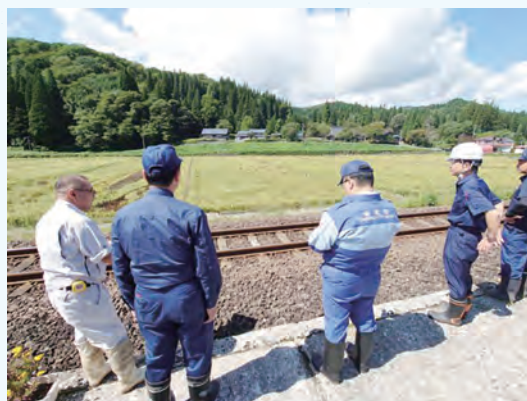
▲現地視察(上桧木内地区)

水土里ネット秋田では、今年の豪雨災害についても、秋田県災害支援協議会からの支援要請を受け、仙北市、鹿角市、北秋田市、五城目町の農地・農業用施設災害の災害復旧事業の査定設計書作成について、支援を行っております。