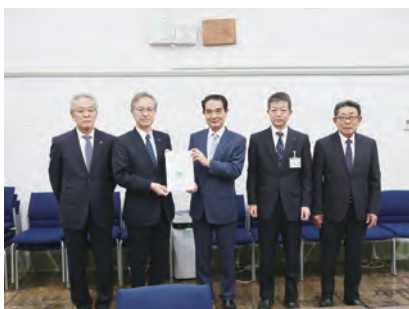
▲宇波主計局長への要請