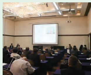
▲研究発表会の様子