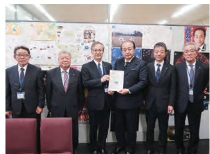
▲御法川議員への要請