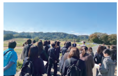
▲現地研修の様子(平良木地区)