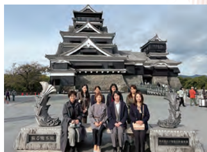
秋田県参加者集合写真