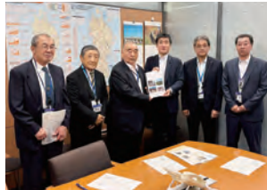
(大館・北秋田支部)