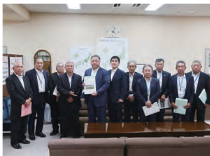
▲松本局長への要請