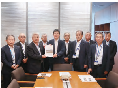
▲福原議員への要請