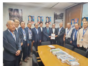
▲進藤議員への要請