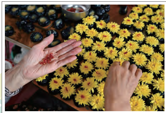
▲第25回「あきたの美しく豊かな農村づくり」写真コンクール受賞作品▲