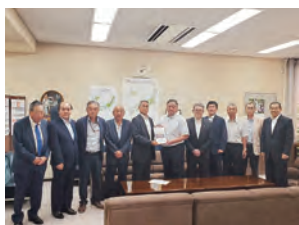
▲松本局長への要請