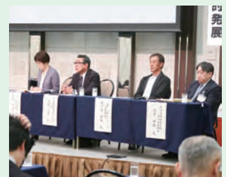
▲ロールセッションの様子