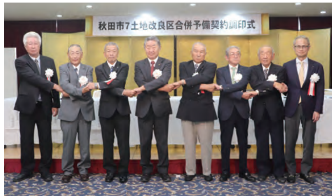
調印した7改良区理事長と青木産業振興部長

7月30日(水)に秋田市内7土地改良区の合併予備契約調印式がアキタパークホテルにて開催された。各土地改良区の総会や総代会での合併決議後、令和8年1月30日(金)に新設合併で「秋田市土地改良区」が発足する見込みとなっている。合併する土地改良区は、秋田市豊岩中央、秋田市上北手猿田、仁井田堰、秋田市上北手小山田、河辺、河辺郡芝野堰、左手子の7土地改良区。