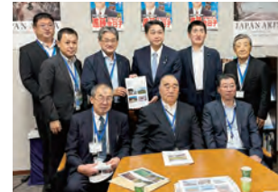
(大館・北秋田支部)