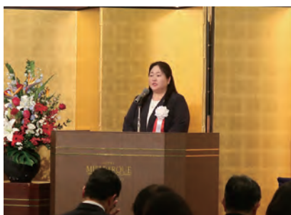
西全国水土里ネット女性の会長挨拶