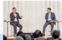
▲土地改良区対談の様子 【左】広瀬桃木土地改良区(群馬県) 【右】仙台東土地改良区(宮城県)