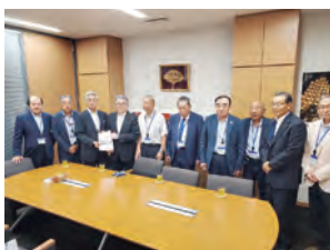
▲富樫議員への要請