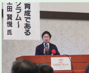
▲特別講演を行う秋田県立大上田教授