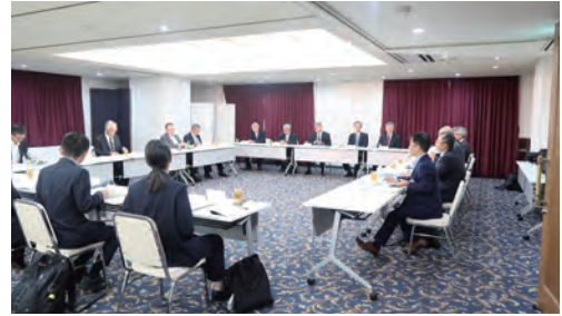
▲意見交換会の様子