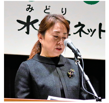
▲大会決議和田事務局長