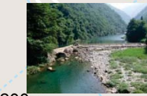
みかえり 回顧の滝

「わらび劇場」「温泉ゆぼぼ」「森林工芸館」などがあり、芸術・食・温泉をまるごと楽しめます。ウォーキングのあとは、温泉入浴をどうぞ！ 【営業時間 10:00～22:00】