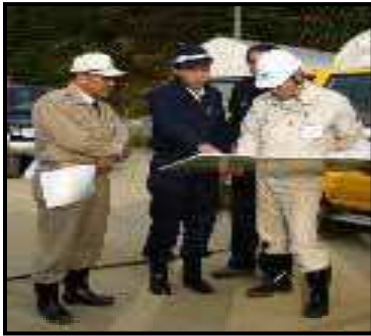
①農地・農業用施設等の現地被災状況等の把握に係る支援

各都道府県(以下「各県」という)の農村防災・災害対応協議会(仮称)(または準備会)(以下「協議会」という)の定めにより、以下のような活動を行います。