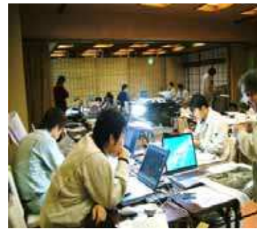
③災害復旧業務(災害査定に向けた準備業務)に係る技術支援