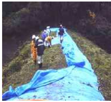
②応急対策に係る技術支援