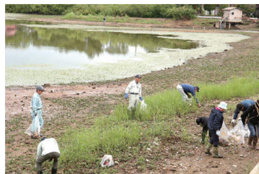
農業用施設のクリーンアップ