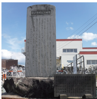
土地改良区の沿革が刻まれた石碑