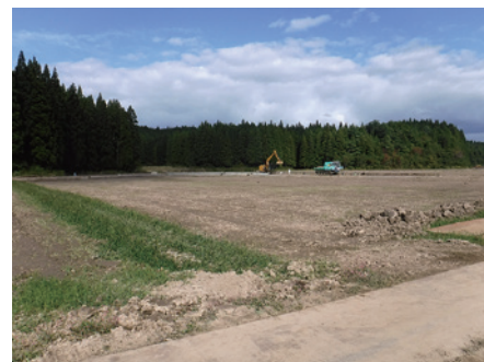
金足東部地区ほ場整備事業工事状況