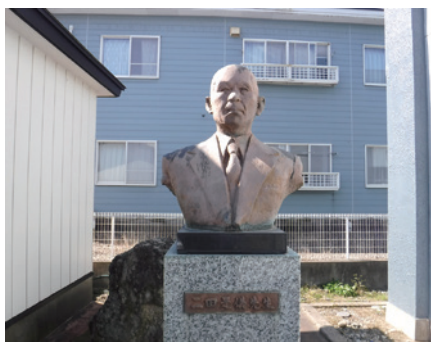
初代理事長二田是儀氏の銅像