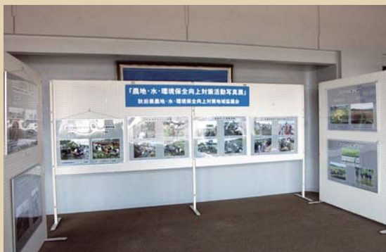
農地・水パネル展