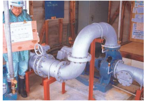
▲バルブ据付:町後2号揚水機(潟上市昭和)